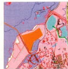
Условные обозначения вида разрешенного использования для размещения объектов капитального строительства